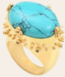
Bague LETICIA PONTI - 190€