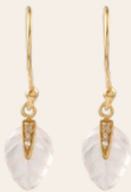
BO LETICIA PONTI - 70€