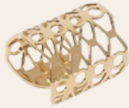
Bague CHIC ALORS! - 39€