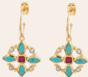
BO LETICIA PONTI - 138€