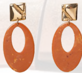
BO CHIC ALORS! - 98€