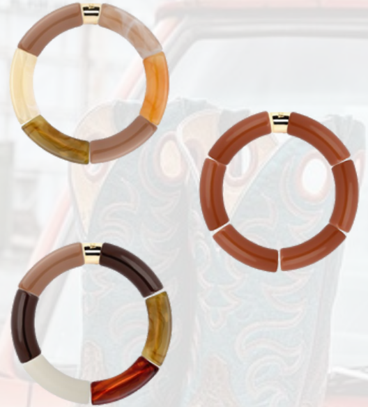
Bracelets PARABAYA - 35€