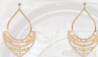
BO CHIC ALORS! - 55€