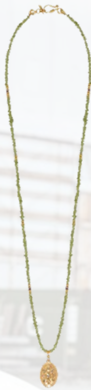
Collier LETICIA PONTI - 260€