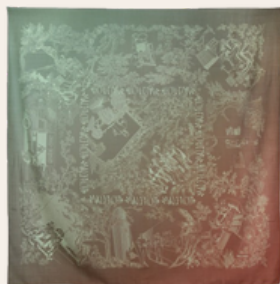
Foulard de soie 120cm