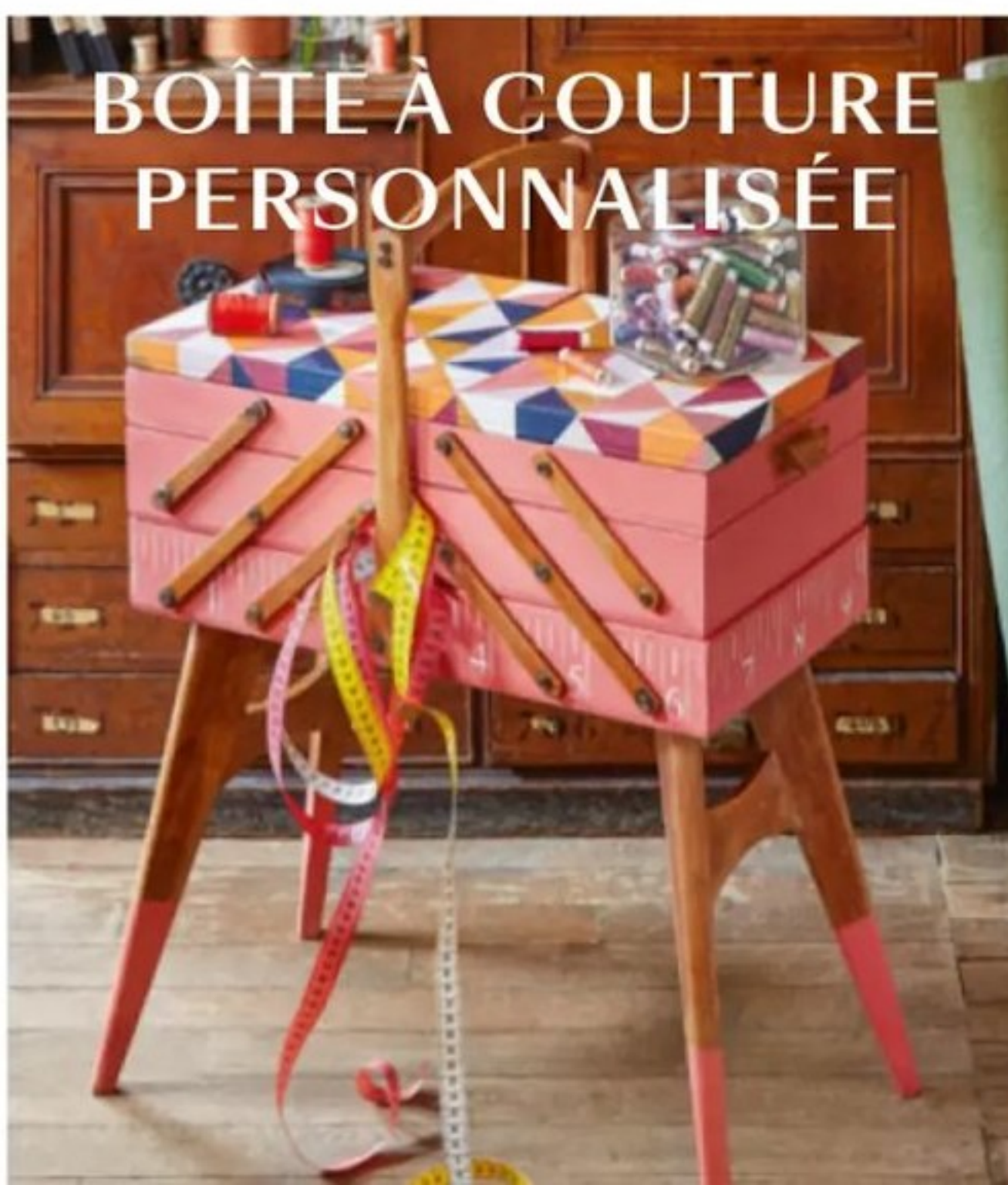
BOÎTE À COUTURE PERSONNALISÉE