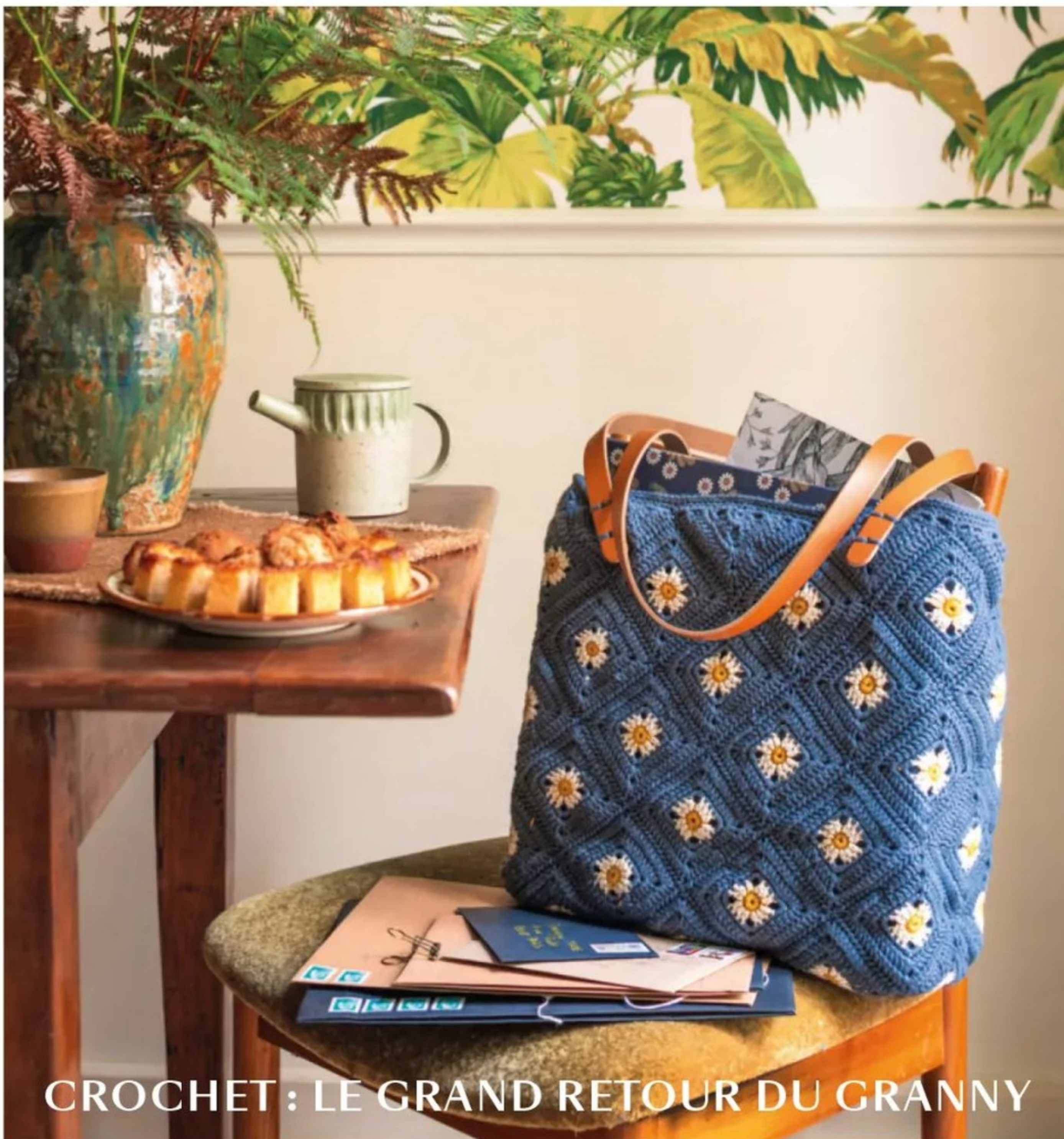
CROCHET : LE GRAND RETOUR DU GRANNY